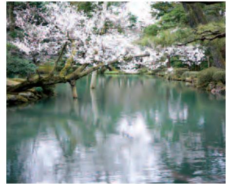
El haiku acostuma a expressar el que es percep pels sentits en contemplar la natura, la realitat.